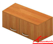
TCW ตู้แขวนติดผนังเอกสารไม้