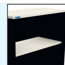
แผ่น TOP ตู้และแผ่นชั้นวางที่สูง ใช้ไม้หนา 25 mm. เพื่อเพิ่มความแข็งแรง และปิดผิวด้วยเมลามีนทั้ง 2 ด้าน