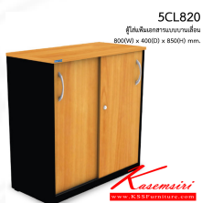
5CL820 ตู้ใส่แฟ้มเอกสารแบบบานเลื่อน 800(W) x 400(D) x 850(H) mm.