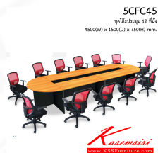
5CFC45 ชุดโต๊ะประชุม 12 ที่นั่ง 4500(W) x 1500(D) x 750(H) mm.