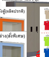
WD3FSM ตู้เสื้อผ้าบานเปิดทึบ W92xD53.4xH122.5 cm. กลาง 3 ฟุต