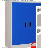
WD3FSM ตู้เสื้อผ้าบานเปิดทึบ W92xD53.4xH122.5 cm. กลาง 3 ฟุต