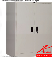
WD3FSM ตู้เสื้อผ้าบานเปิดทึบ W92xD53.4xH122.5 cm. กลาง 3 ฟุต