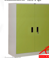
WD3FSM ตู้เสื้อผ้าบานเปิดทึบ W92xD53.4xH122.5 cm. กลาง 3 ฟุต