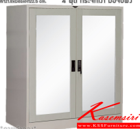
SC4FMRSM ตู้เอกสาร 2 บานเปิดกลาง W121.8xD46xH122.5 cm. 4 ฟุต กระจกเงา มือจับฝัง