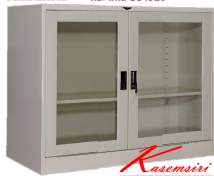
SC4FGLSS ตู้เอกสาร 2 บานเปิดเตี้ย 4 ฝุต กระจกใส มือจับฝัง