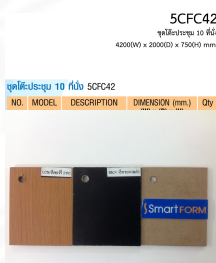
5CFC42 ชุดโต๊ะประชุม 10 ที่นั่ง 4200(W) x 2000(D) x 750(H) mm.