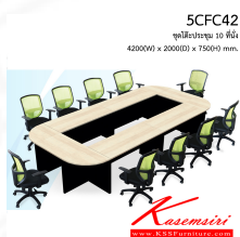
5CFC42 ชุดโต๊ะประชุม 10 ที่นั่ง 4200(W) x 2000(D) x 750(H) mm.