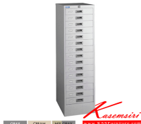
FC-215 W37.5xD45.7xH132 CM.

GRAY CREAM MIX GRAY www.KSSFurniture.com