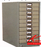
FR-110 ตู้เก็บแบบฟอร์ม 10 ลื่นชัก 263(W) x 381(D) x 521(H) mm.