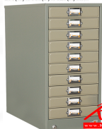
FR-110 ตู้เก็บแบบฟอร์ม 10 ลื่นชัก 263(W) x 381(D) x 521(H) mm.