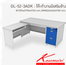
DL-52-3ADK : โต๊ะทำงานมีเสริมข้าง W1595xD795xH740 mm./W900xD440xH700 mm.