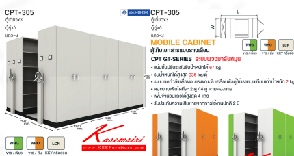
CPT-305(3แถว) 2540(L) x 3660(W) x 2250(H) mm.