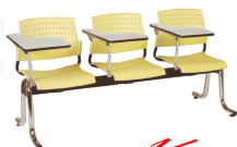
VC622 3 seats - W165 D62.5 H77.5 CM.