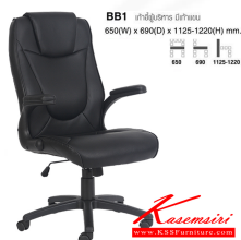
BB1 เก้าอี้ผู้บริหาร มีเท้าแขน 650(W) x 690(D) x 1125-1220(H) mm.

เก้าอี้ผู้บริหาร มีเท้าแขน BB1 สีดำ เก้าอี้ผู้บริหารมีเท้าแขน โทนสี สบาย สบาย สบาย พนักพิงและเบาะนั่งทำด้วยหนัง PU ที่มีความนุ่มสบาย เบาะนั่งมีที่ปรับระดับความสูงได้ ปรับระดับความสูง - ตัว โต๊ะใช้ Gas Lift ทำมาจากเหล็ก PP พื้นผิว PU โดดเด่นทนทาน