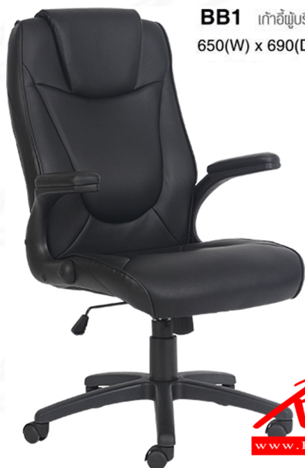
BB1 เก้าอี้ผู้บริหาร มีเท้าแขน