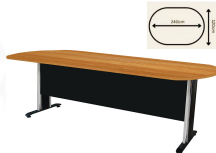
ปิดผิวเมลามีน