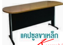
แคปซูลขาเหล็ก