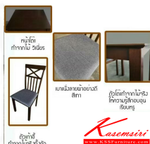
LEYLAND (เลย์แลนด์) ชุดโต๊ะอาหาร 4 ที่นั่ง ขนาดโต๊ะ 110x70x73.50 CM. ขนาดเก้าอี้ 41x41.50x95 CM.