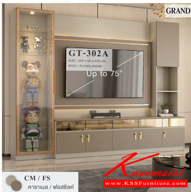
CM / FS คาราเมล / ฟอสซิลค์