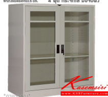
SC4FGLSM ตู้เอกสาร 2 บานเปิดกลาง W121.8xD46xH122.5 cm.