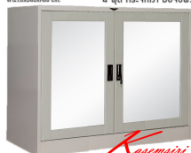
SC4FMRST2 ตู้เอกสาร 2 บานเปิดเดี่ยว W121.8xD46xH88 cm. 4 ฝุต กระจกเงา มือจับฝัง