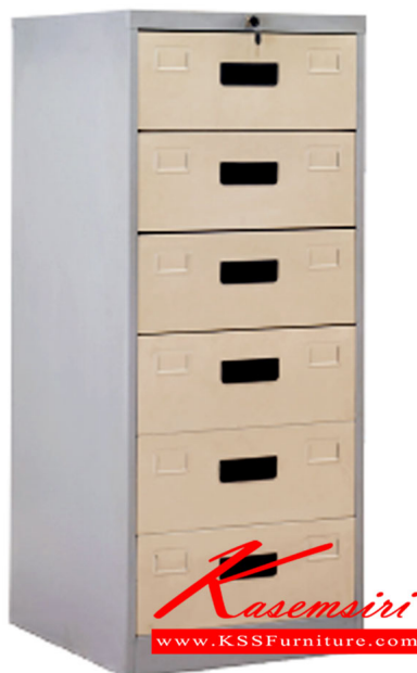
FDC06 ตู้ 6 ล็อก (ตู้เก็บบัตร) Size 54 x 62 x 132 Cm.