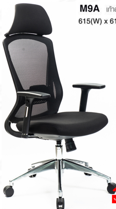
M9A เก้าอี้สำนักงาน มีเท้าแขนและพนักพิงศีรษะ 615(W) x 615(D) x 1185-1280(H) mm.