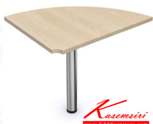
MTCS 86 W80xD60xH75 CM. MOTION SERIES