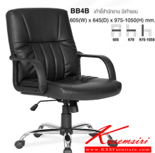
BB4B เก้าอี้สำนักงาน มีเท้าแขน 605(W) x 645(D) x 975-1050(H) mm.