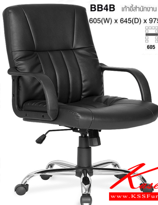
BB4B เก้าอี้สำนักงาน มีเท้าแขน