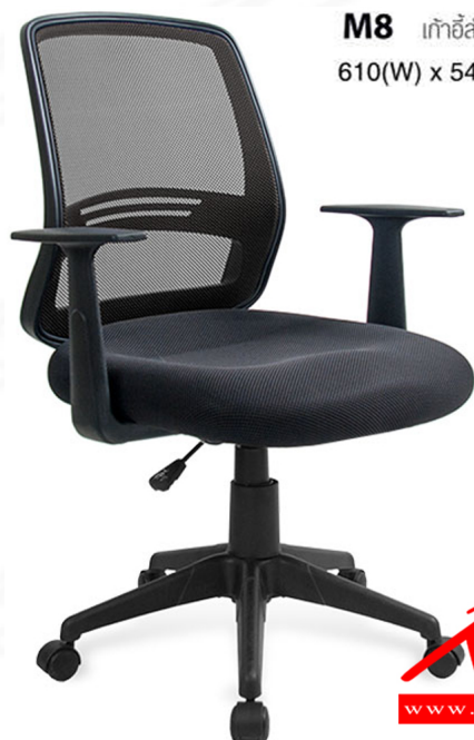
M8 เก้าอี้สำนักงาน มีเท้าแขน 610(W) x 545(D) x 905-996(H) mm.